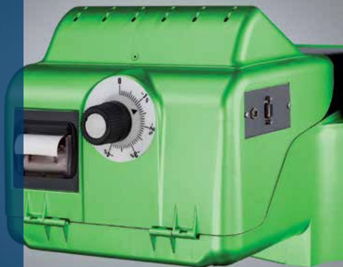
Integreret printer til dokumentation af testresultaterne selv uden en PC-tilslutning