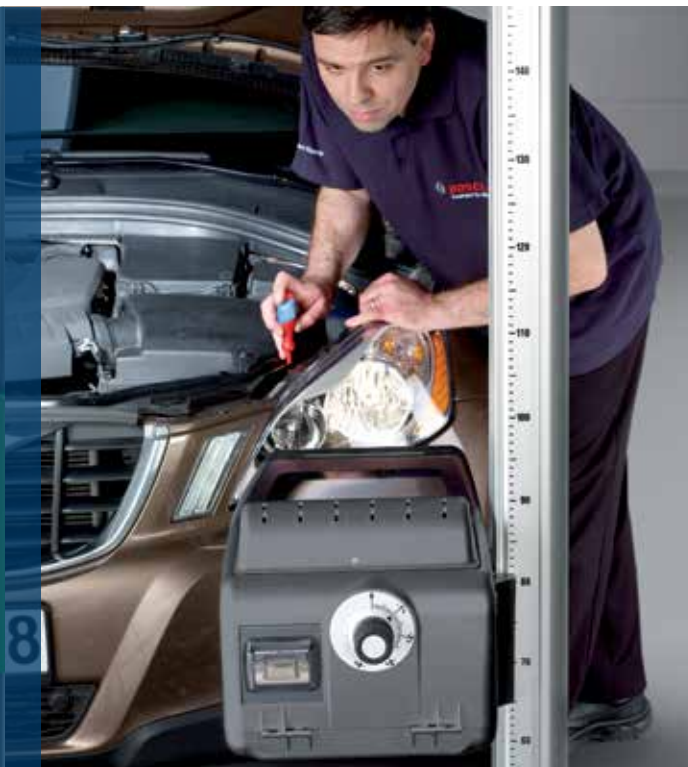
Ergonomisk brug ved køretøjet – displayet kan drejes 180 grader

Bosch HTD 615 er et fotodiodeapparat til indstilling af forlygter, som giver en pålidelig monitorering og bedømmelse af alle gængse forlygtesystemer. Brugeren guides igennem testproceduren med visuelle og akustiske signaler. Specialfunktioner understøtter indstillingen. Apparatet er robust konstrueret til værkstedsbrug og ergonomisk at anvende. Indstillingen sker pålideligt ved hjælp af laserteknologi og hurtigt ved hjælp af en microcontroller.