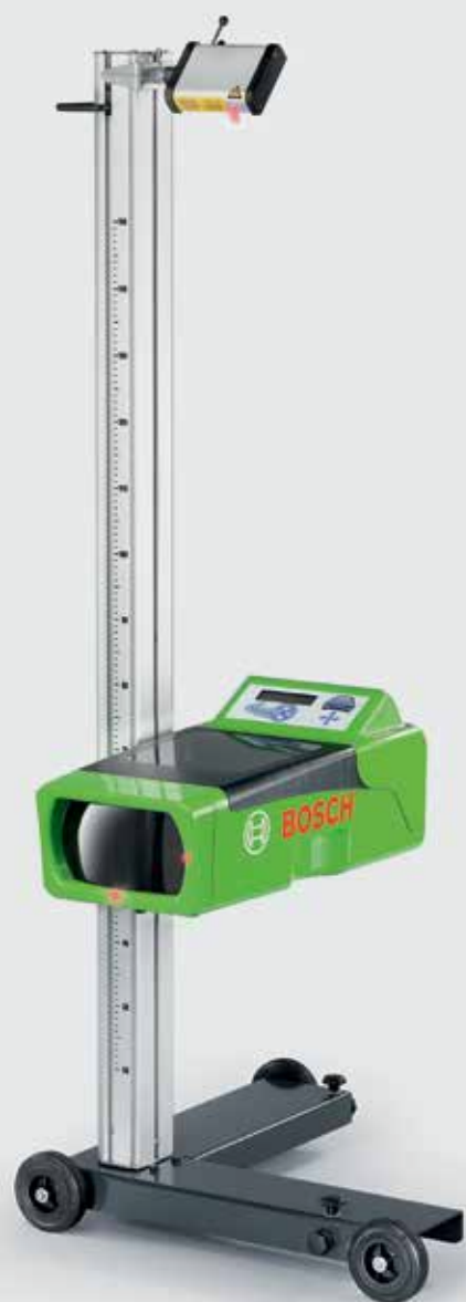
Der tages forbehold for tekniske ændringer og programændringer