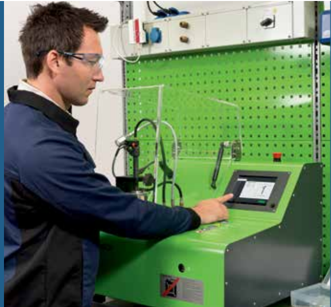
Nem betjening via berøringsskærm selv uden forudgående viden om testning af dieselinjektorer

Andelen af common rail-systemer i dieselmotorer fortsætter med at stige. Den nye EPS 118 tilbyder præcisionsteknologi fra Bosch til en overkommelige pris, så selv mindre værksteder har mulighed for at få del i dette voksende marked med en minimal udgift.