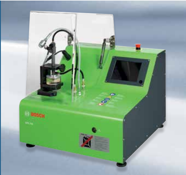
EPS 118: Pladsbesparende og robust desktop-service med gennemsigtigt kammer